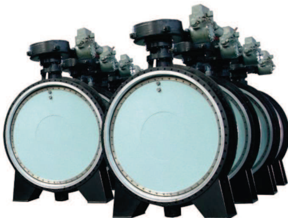
D-41X krótka zabudowa

Wykonane wg: ISO 5752 seria 13 (EN 558-1 seria 13) DN 100 – DN 4000 PN 6 – PN 40